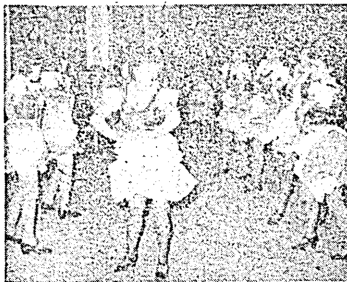
Pe scenă, echipa de dansuri populare „Viola” a Casei de cultură a municipiului.