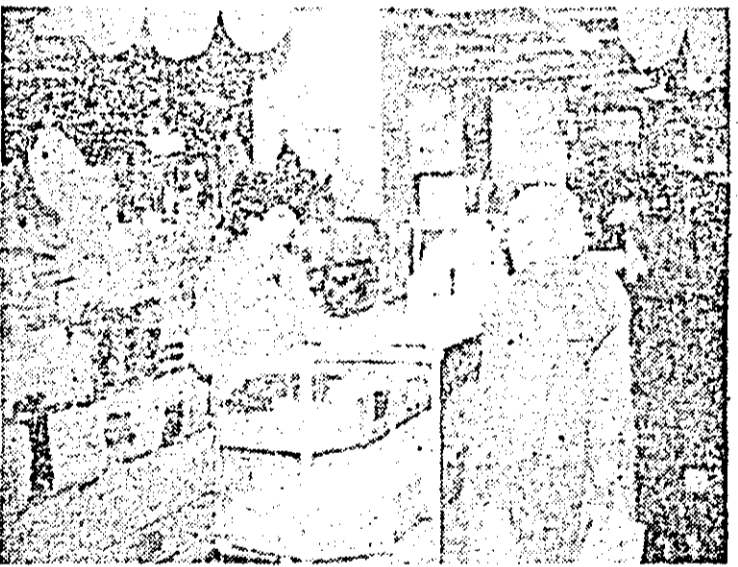
Aspect din raionul tricotaže copii al magazinului universal „Ziridava”.

tenț cu ridicarea nivelului tehnic și calitativ al producției. În fond este vorba despre trecerea hotărîtă la dezvoltarea intensivă a economiei, concretizată în sporirea rentabilității și beneficiului în fiecare unitate ca rezultat al valorificării mai înalte a materiilor prime, a reducerii cheltuielilor de producție. Cum bine se știe, în fiecare unitate au fost elaborate programe speciale care să asigure îndeplinirea exemplară a planului pe acest an. Adunările generale ale oamenilor muncii, recent încheiate, valorificînd tezaurul de idei al inițiativei muncitorești, au completat aceste programe cu noi măsuri. Hotărîtoare sînt munca oamenilor, angajarea lor fermă, cu răspundere și elan revoluționar pentru îndeplinirea exemplară a tuturor sarcinilor.