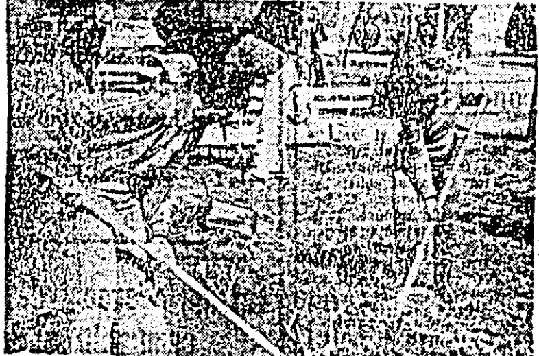
Se înfrumusețează Nădlacul.

Impresia că lucrurile sînt doar la început în comuna Zăbrani a fost întărită și de un alt aspect: pe străzi sînt cam multe gunoale. În fața cofetăriei zac pahare de plastic, ambalaje de bomboane, biscuiți, hîrții etc. Ele se întind și pe străzi, chiar și în fața școlii. Se pare că cei ce consumă dulciurile — copiii — nu au încă obișnuința de a arunca ambalajele în locurile permise. Aflăm că se vor pune coșuri pentru hîrție — vreo 20. Dar n-ar strica și un pic de educație la orele de dirigenție. Se mai află în întîrzieri și responsabilii de la remiza de pompieri sau magazinul sătesc. Vitrinele de acolo sînt sparte, ambalajele stau împrăstiate în stradă. — Tovarășe Restea, cum stați cu depozitarea resturilor menajere? — Am ales un loc mai dosnă pentru asta. La intrarea în comună însă, chiar la șosea, e un mare șanț cu cutii de conserve ruginite, fier vechi, foi deteriorate de plastic, hîrții. Acest fenomen — a arunca gunoale la intrarea sau ieșirea din localități — există și la Sînicolaul Mic, Prumușeni, Lipova chiar. Sperăm să nu fie tot o tradiție, ci o obișnuință necorctă. I. J.