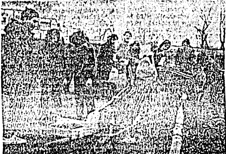
Elevi de la Liceul „I. Slavici” la muncă patriotică.

— Exact. Dar știm că se lucrează la ele. Vă mulțumesc pentru informații și să auzim ce e nou la Ineu. — Pulu Bucur și Ioan Bugartu transmit că avem obiective mobilizatoare: reparatii de străzi și trotuare pe 102.000 metri pătrați... — Intră cumva în obiectiv portul deteriorate de pe străzile Republicii, Decabal din centru? — Intră, ca și cele peste 50 hectare zone verzi. Se plantează gard viu pe 5 km, iar acum noștii o inițiază locală... — Să auzim. — Cîte un arbore de fiecare locuitor: peste zece mii în total. — Frumos, dar cetățenii ce zic? — S-au angajat să presteze munci de înfrumusețare și gospodărire pînă la suma de aproape 5 milioane lei. — Dar cei ce rup trandafirii, ce zic? — Da, cam rup florile unui flaneler de pe la noi. Trebuie făcut ceva. De la Pincota aflăm, prin intermediul tovarășei Viorica Tomodan, că sute de cetățeni participă la lucrările de înfrumusețare ca și elevii din localitate. În serale orașului sînt pregătite mii de flori, care vor fi sădite în zonele verzi. Pincota va fi și în acest an un oraș al florilor. Sună Sebișul, tovarășul Vitalie Munteanu: „Aici se pune problema unei optici noi de arhitectură peisagistică, care va schimba fața orașului. Se va acționa pentru înfrumusețarea zonelor verzi, cu arbori noi, modernizarea străzilor Someșului și Dunării, scoțerea de sub apă a unor porțiuni de străzi, prin amenajări de dișuri.” I. JIVAN