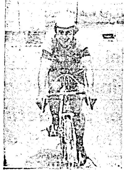
DAN DUMA: După o sută de kilometri, oboseala un este altă de mare dacă... al ieșit primul!