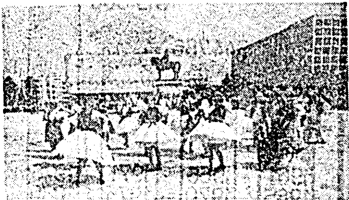
Artiștii amatori din Almaș în timpul parăzii portului popular pe străzile Tulcei.