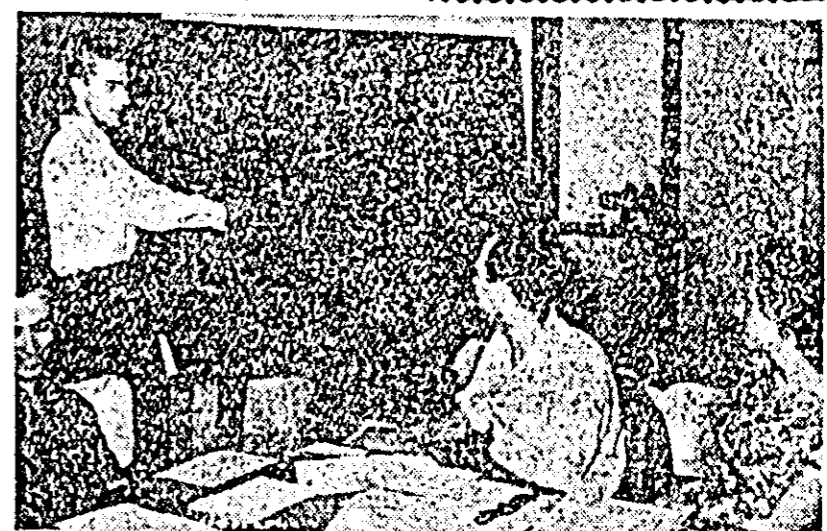
Candidatul Ludovic Deutsch (Școala medie nr. 2 — secția serală) rezolvă cu multă pricepere o problemă dificilă de matematică.