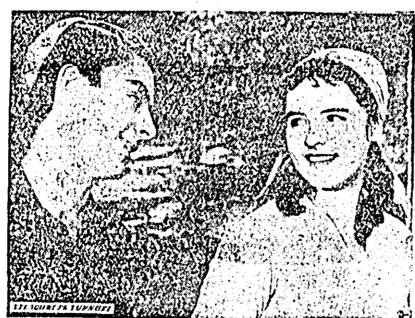
În clipșu: o scenă din filmul sovietic „Steaguri pe turnuri” care rulează pe ecranul-cinematografual „Nicolae Bălcescu”.