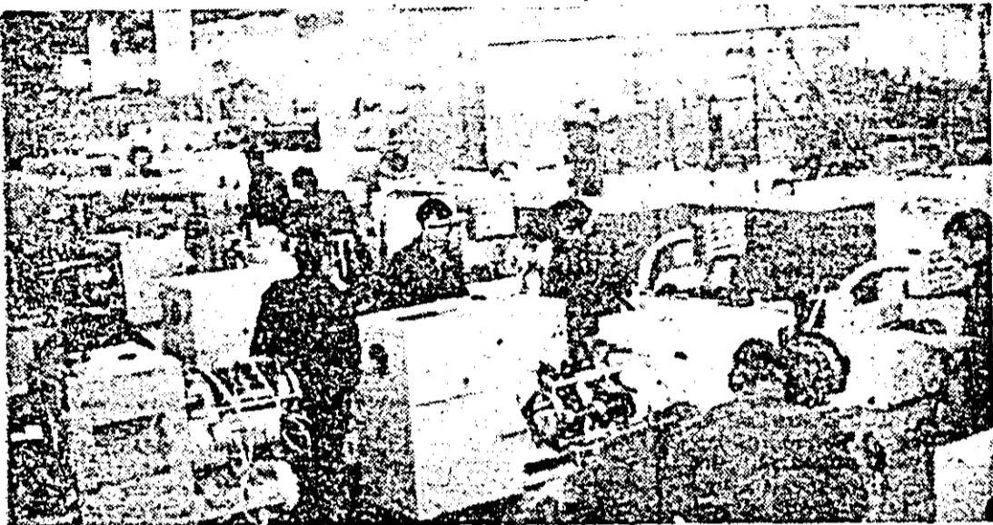
Aspect de muncă în atelierul montaj al întreprinderii de strunguri.

ORGAN AL COMITETULUI JUDEȚEAN ARAD AL PARTIDULUI COMUNIST ROMÂN ȘI AL CONSILIULUI POPULAR JUDEȚEAN