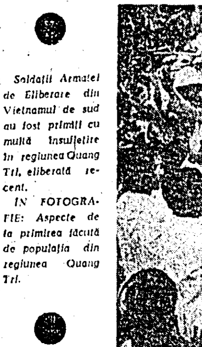
Soldatii Armatei de Eliberare din Vietnamul de sud au fost primii cu multă înălțime în regiunea Quang Tri, eliberată recent.

și tehnice de luptă. Artileria patrioților a supus unui puternic bombardament grupurile de militari saigonezi aflați la nord-est de oraș, far într-un punct situat la 5 km sud de riuul My Chanh, efective de parașutiști saigonezi dislocate în zonă au fost obligate să se retragă sub presiunea forțelor patriotice.