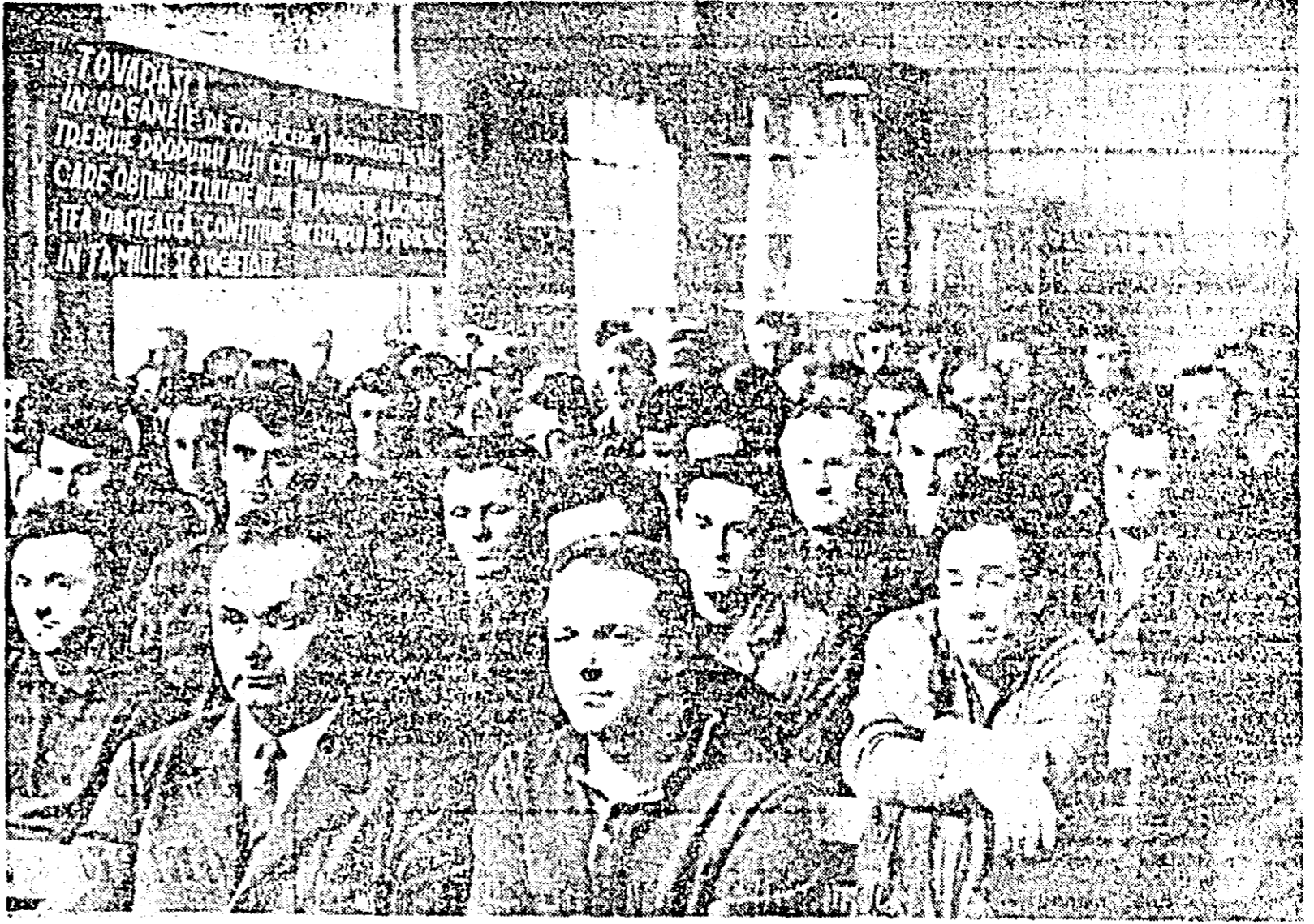
Aspect de la adunarea de alegeri, sectorul II — Icătuși — al Uzinei de vagoane.

Alegerile de partid sînt în toi. Este necesar ca pretutindeni acestea să fie pregătite cu toată răspunderea, astfel încît să constituie cu adevărat un moment important în viața organizațiilor de partid, un prilej pentru mobilizarea mai puternică a membrilor de partid, a tuturor oamenilor muncii la transpunerea în viață a hotărârilor adoptate de Congresul al X-lea și Conferința Națională a partidului.