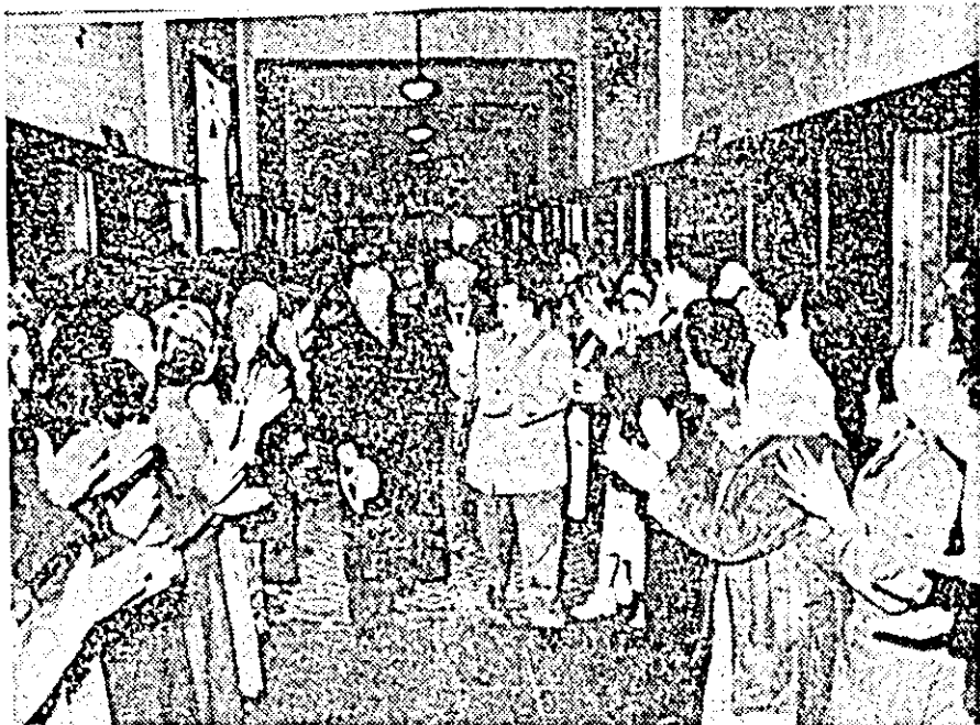
Printre oaspeții care ne vizitează în aceste zile țara se află și delegația de vechi militanți ai P.C.U.S.

ÎN CLISEU: membrii delegației de vechi militanți ai P.C.U.S. în mijlocul unui grup de muncitori de la fabrica de confecții „Gheorghe Gheorghiu-Dej” din Capitală.