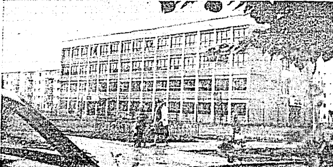
Curată și luminoasă Școala generală nr. 22 din Măcălaca este gata să-și primească „locatarii”.

Ne mai desparte puțin timp de deschiderea unui nou an de învățămînt. Pe agenda activităților colectivelor de conducere ale unităților de învățămînt și cadrelor didactice de toate specialitățile se află numeroase sarcini prioritare, am spune hotărîtoare pentru buna desfășurare a procesului instructiv-educativ. Pentru a afla modul în care este pregătită baza tehnico-materială în vederea noului an de învățămînt, redacția ziarului „Flacăra roșie” a efectuat o anchetă în mai multe unități școlare din județul și municipiul nostru. În acest sens am urmărit îndeaproape încheierea lucrărilor de reparații curente și capitale, igienizarea tuturor spațiilor școlare și folosirea intensivă a acestora, verificarea instalațiilor electrice și de încălzire centrală, ori realizarea aprovizionării cu combustibil în raport cu repartițiile date. În pagina de față prezentăm o parte din constatările efectuate cu prilejul anchetei ziarului nostru.