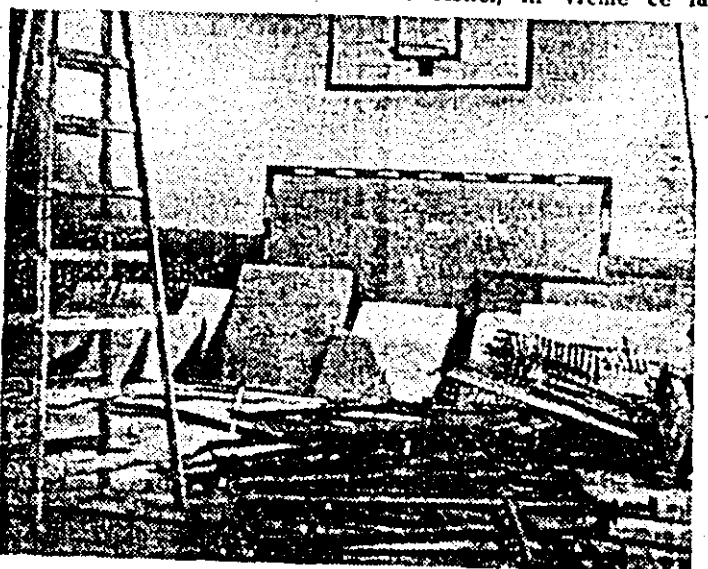
Așa arată sala de sport a Școlii generale nr. 3 în prag de nou an de învățămînt.

E. ȘIMANDAN M. DORGOȘAN D. TOMA