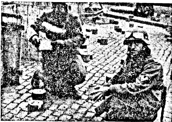
După ocuparea orașului Bruxelles de trupele germane Soldați germani la cercetarea minelor.

Londra, 30. (Rador.) — Măsuri speciale de precauțiune au fost luate pentru garantarea securității palatului Westminster de funcționează Camera Comunelor. Deputații și funcționarii Camerei, vor trebui să aibă cărți de identitate speciale pentru a putea pătrunde.