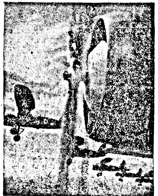
Un avion de vânătoare francez în timpul unui atac.

Paris, 30. (Rador). — Agenția Havas transmite: Inaltul comandament norvegian anunță că în regiunea Ofoten, detașamentele norvegieni și aliate au înaintat până la râul Nygardevath și până la Haufhjell. La Sud de Haalogaland nimic de semnalat.