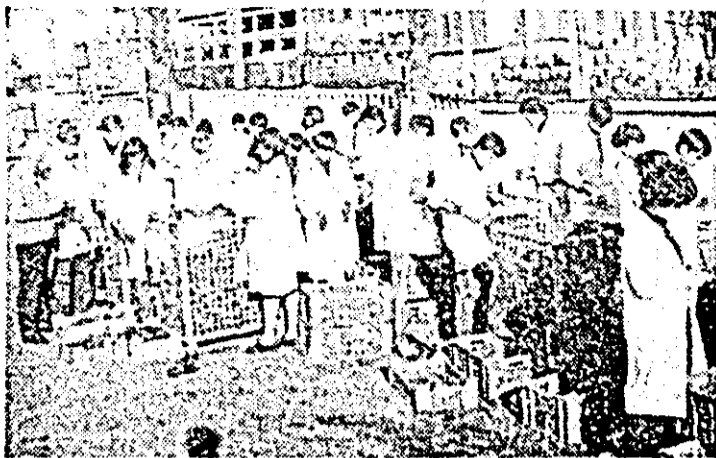
Hotărîți să înscrie în bilanțul muncii lor noi și însemnate realizări productive, elevii Liceului Industrial nr. 3 din Arad, aduc o substanțială contribuție la sortarea și conservarea bogatelor roade ale toamnei, în cadrul întreprinderii „Refacerea”.

— Ne preocupăm și în continuare, ca toți tinerii satelor și comunelor să participe la lucrările care au mai rămas de efectuat, în așa fel încît acestea să fie realizate în bune condițiuni, pentru obținerea, în anul 1982, a unor recolte cât mai îmbelșugate.