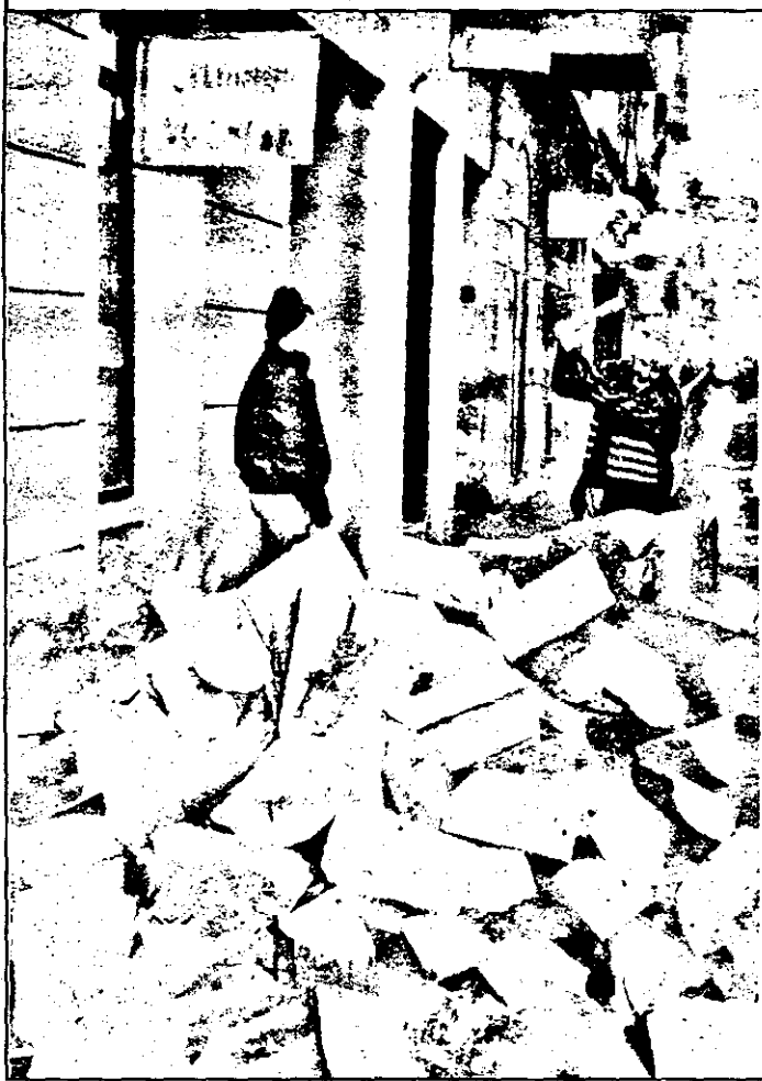
E, totuși, vremea lemnelor de foc!

nuă să dea mari dureri de cap echipei de anchetatori însărcinate să descopere pe ucigașul cunoscutului artist, care a căzut victimă unui agresor, cu peste o lună în urmă. Până la ora actuală, nu se poate spune că s-a avansat în vreun fel în direcția prinderii autorului, deși poliția se află în posesia unor dovezi materiale ale prezenței criminalului în locuința lui Mihalea, care ar putea duce la individualizarea sa. Este vorba de amprente digitale, de urmele unei încălțări prelevate în locuința victimei, ce indică existența unui bărbat de 60-65 kg, precum și de fire de păr blond. Ancheta se află în impas - a declarat o sursă din cadrul Poliției - pentru că este aproape imposibil de stabilit cine este blondul ucigaș, având în vedere că numai în București există 300 000 - 400 000 de blonzi, un număr similar de bărbați având o greutate între 60-65 kg, precum și datorită faptului că amprente prelevate nu se află fișate în evidențele poliției. În prezent, se procedează prin eliminare, pentru a se ajunge la un cerc cât mai restrâns de bănuți.