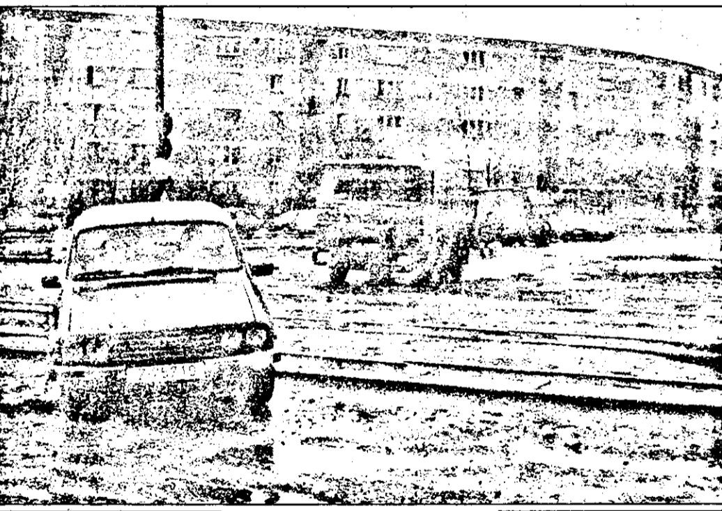
O traversare cu probleme deopotrivă pentru automobilisti și automobile: cea a liniilor de tramvai din zona Gării CFR Arad, datorită denivelărilor existente. Se pare că singurii care se bucură de situația existentă sunt mecanicii auto...