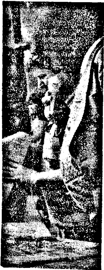
Se caută noutățile zilei.