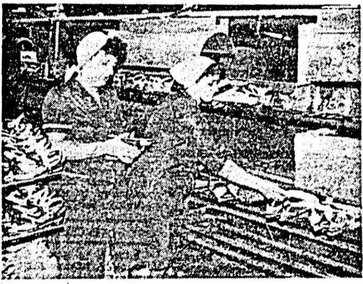
Aspect de muncă în atelierul tras-tălpuit al întreprinderii „Libertatea”.