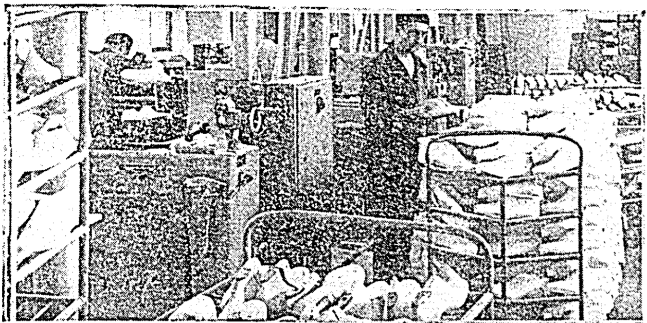
Imagine din secția calapoade a fabricii de încălțăminte „Libertatea” din Arad.