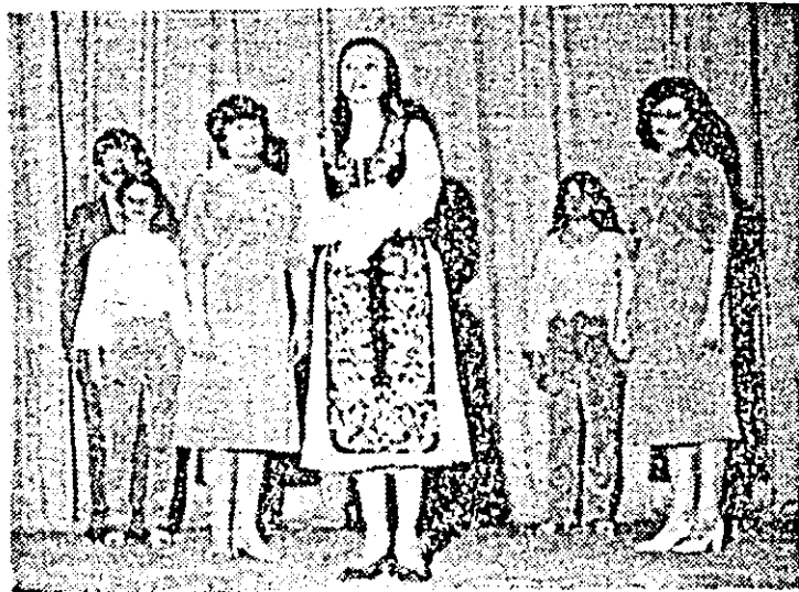
Grupul vocal al clubului muncitoresc „UTA”.