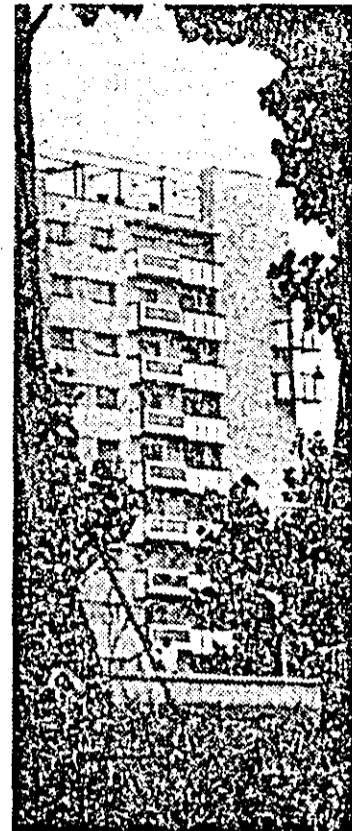
Ilustrată arădeană.

Decl. la S.M.A. Sîntana se acționează cu hărnicie și răspundere.