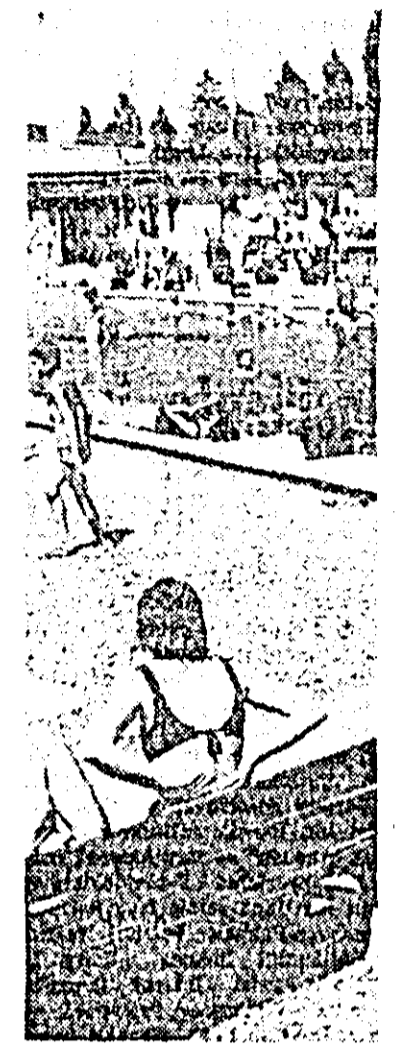
„Sezon plin la băile termale-Gal”.

Filiala județeană Arad a Uniunii Ziaristilor din Republica Socialistă România, invită colaboratorii, corespondenții voluntari, precum și cititorii ziarului „Flacăra roșie” și „Vörös lobogó” să participe la adunarea festivă organizată cu prilejul Zilei preselor românești. Adunarea va avea loc în ziua de 14 august a.c., orele 17.30, în sala Consiliului județean al sindicatelor din B-dul Republicii nr. 81.