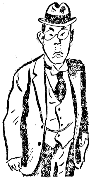
HIRANUMA japán miniszterelnök

A Giornale d'Italia hosszabb cikkben kommentálja az angol-japán egyezményt. A lap azt állítja, hogy Anglia nemcsak hogy behódolt Japánnak, hanem nagyobb kölcsönt is ajánlott fel. A szerződés az angol politika teljes páfordulását jelenti. Anglia elfordult Csang Kai Sektől, miután ellenállásra huzdította. Ez bizonyítja, hogy mit jelent Anglia támogatása és barátságai szerződése, amit olyan nagyvonalúan szokott felajánlani.