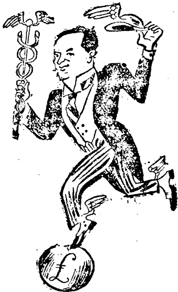
HUDSON angol kereskedelmi államtitkár

is. A háborút, mint lovastiszt kezdte, azután Blomberg tábornok szárnysegédje lett, majd a Romániában harcoló német hadsereg egyik parancsnoka. A háború után politikai, gazdasági szolgálatba lépett és állandóan utazik. Az angol-