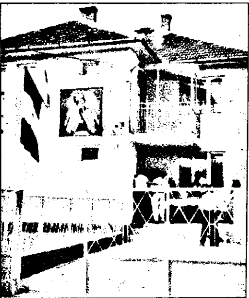
Portretul lui Avram Iancu pe fațada Primăriei, semn al închinării noi Primăriei memoriei înaintașilor care s-au jertfit pentru libertate...