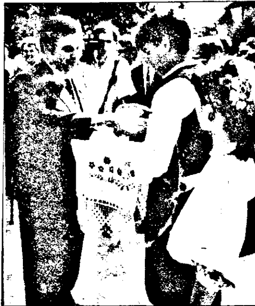
Oaspeții de onoare ai comunei au fost primiți în tradiționala ospitalitate românească ...