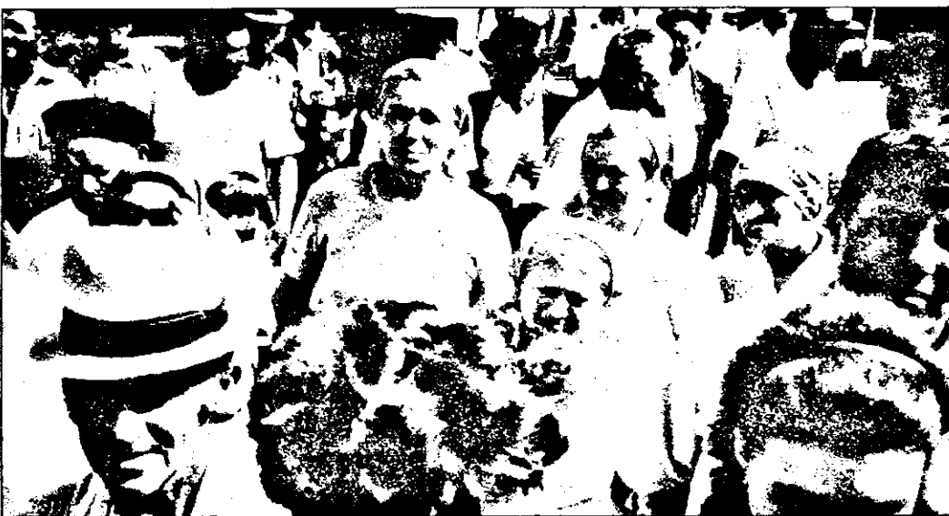
Schimbarea la față a Primăriei - inaugurată de sărbătoarea creștinească „Schimbarea la față” - primită cu bucurie de toți locuitorii comunei.