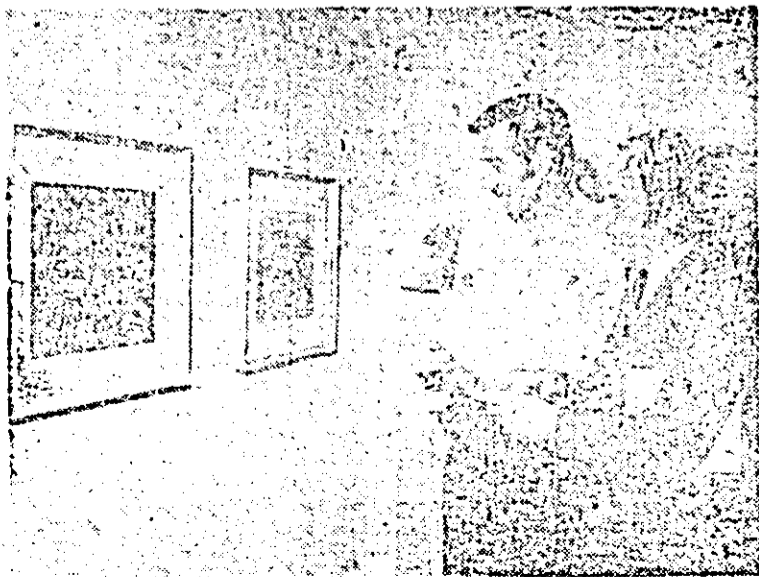
Aspect din expoziție.