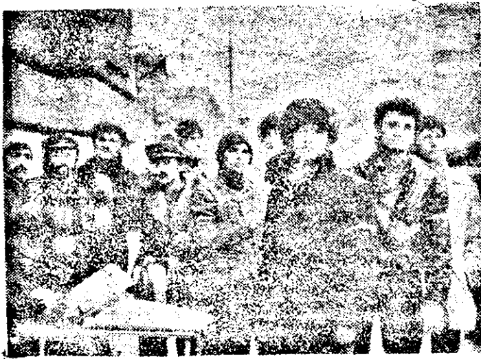
Tineri curajoși, cu banderole albe și tricolore la braț, apără, la fiecare colț de stradă, bucuria noastră.