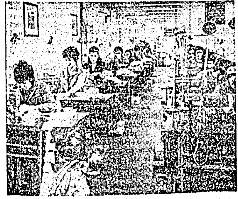
I.L.S. „Arădeanca”. În acest modern atelier se confecționează îmbrăcămintea păpușilor.

Aceste preocupări ale organelor și organizațiilor UTC pentru formarea tinerei generații reprezintă o contribuție adusă procesului de formare a omului nou, omul societății socialiste multilaterale dezvoltate. Sistemul condițiilor care există încă destule carențe în munca noastră, că nu se acționează suficient de către fiecare uleciat, organ și organizație UTC pentru formarea și dezvoltarea tinerei a concepției și înălțării despre lume și viață. Sistemul însă hotărâri să ne aducem o contribuție mai mare în procesul de educare a tinerei generații, să începem neabătut programul stabilit de plenara CC al PCR din noiembrie 1971, pentru a forma tinerii capabili să ducă mai departe tradițiile de lăptă și muncă ale înalțărilor noastre.