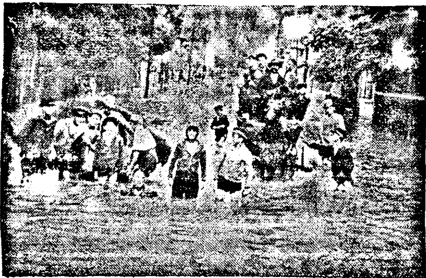
Bei starkem Regen überflutet, ging am Freitag über die Hauptstraße ein Wolkenbruch nieder, welcher einige tiefer gelegene Stadtteile un-