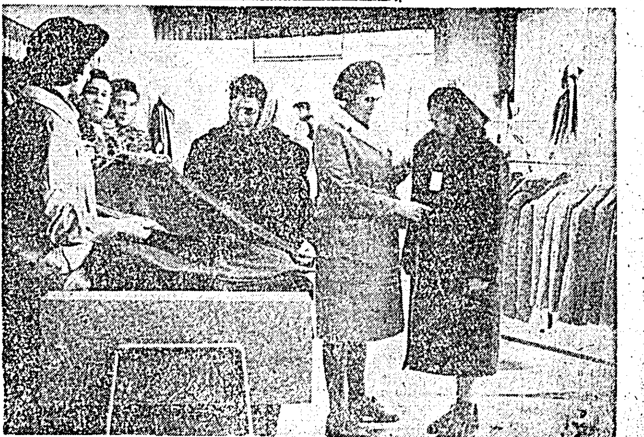
Aprovizionată cu un bogat sortiment de confecții de sezon, unitatea nr. 15 OCL „Produse Industriale” asigură cumpărătorilor o bună deservire. Fotografia redă un aspect din interiorul magazinului.

— Antalși umbli întodeaunc M. ROSENFELD (Continuare în pag. a II-a)