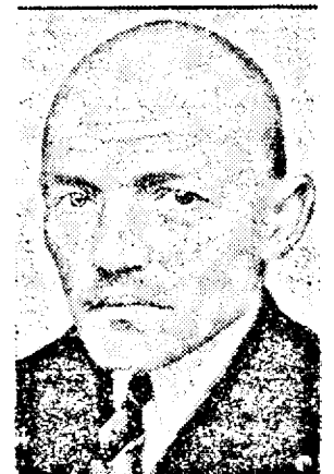
Clișeele noastre arată: Modelul noului avion „Do. X”. Dr. Claude Dornier, genialul constructor.