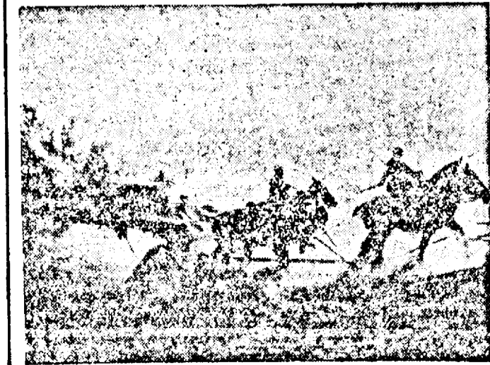
Trupele germane de rezervă se aprovizionează neincetat.