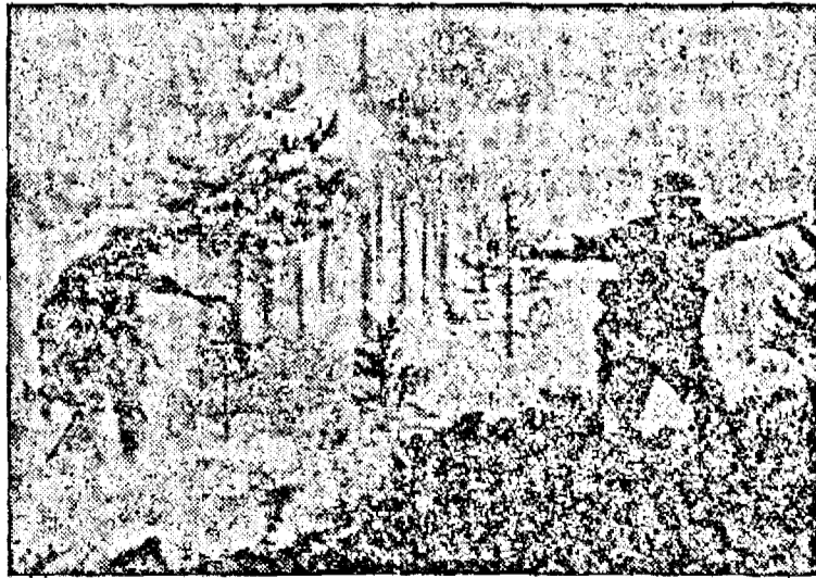
Bolșevici fugând luați sub foc de mitralierele germane (TK. Ob.)

Atacul a fost îndreptat mai ales asu-pra stabilimentelor de armament.