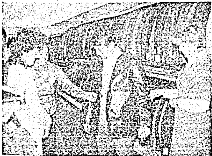
Aspect din magazinul „Adam” al I.C.S. textile-incălțăminte.