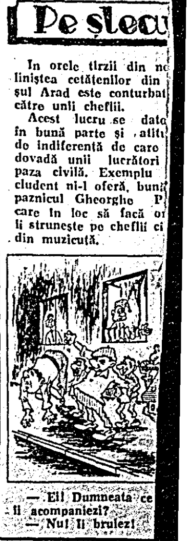
— Eli Dumneață ce-l însoțim și — Nu! Îl brulezi!

În orele trăii din liniștea cătăenilor din Arad este conturbat către unii cheflii. Acest lucru se date în bună parte și altele do indiferență de care dovadă unii lucrători paza civilă. Exemplu cludenț ni-l oferă, bună paznicul Georgeo P. care în loc să facă ori li strunește pe cheflii ci din muzicuță.