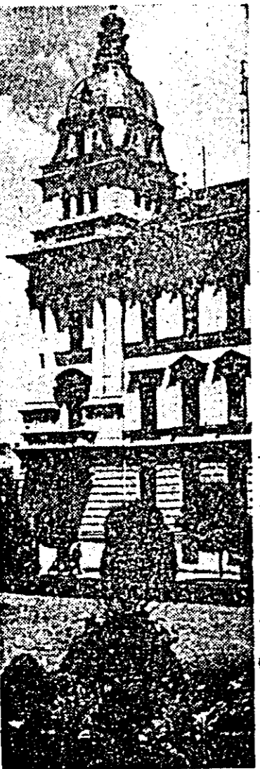
Secvență estivală arădeană.

Aflăm că studioul „Alexandru Sahia” a realizat un nou film documentar, în alb-negru, consacrat vieții și activității lui George Călinescu. Filmul evocă mediul familiar marelui critic și scriitor român.