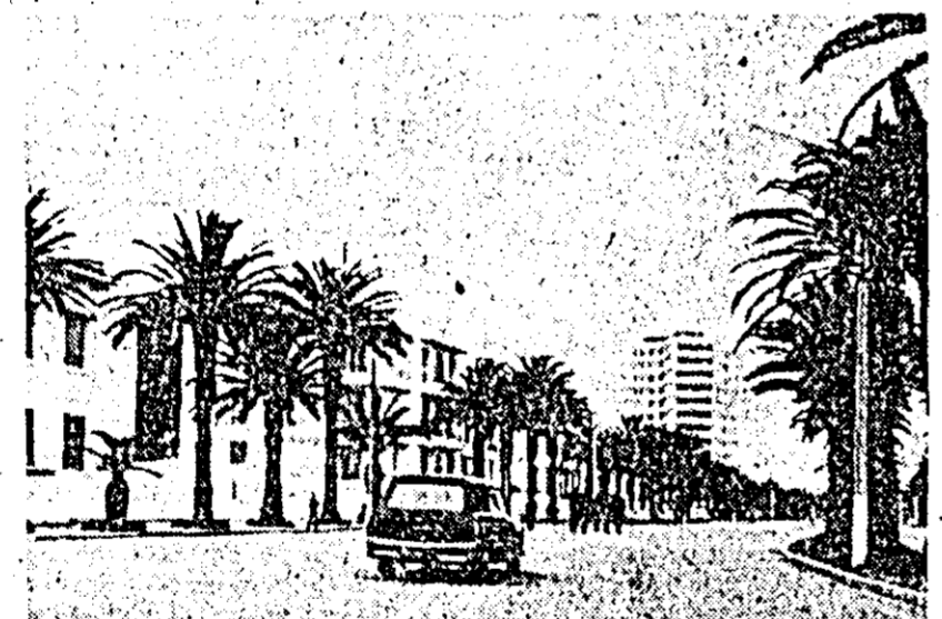
TUNISIA — Vedere din Bizerta.

LONDRA 8 (Agerpres) — Duminică, la Londra au avut loc o serie de demonstrații și contrademonstrații, care au degenerat în ciocniri soldate cu răniți și cu arestări. În Trafalgar Square, mai multe mii de demonstranți au cerut încetarea imediată a ostilităților din Biafra în urma cărora cad zilnic victime foamei peste 3.000 de copii, precum și instituirea unui pod aerian pentru a aproviziona populația cu alimente. Ei au adresat guvernului britanic apelul de a pune capăt imediat livrării de arme pentru Nigeria. Paralel a avut loc o altă demonstrație în cadrul căreia participanții au manifestat în favoarea Nigeriei. Pe de altă parte câteva mii de membri ai „Milsării pentru libertatea colonilor” au demonstrat în fața Președinției Consiliului de Miniștri. Ei au depus o moțiune semnată de 62 de deputați, în care se cere suprimarea imediată a discriminărilor rasiale, în special în ce privește imigrările. Manifestația a fost întreruptă de o altă demonstrație, a adversarilor imigrării în Anglia a populației de culoare. În cursul ciocnirilor, care au avut loc între cele două grupuri și între demonstranți și poliști, au fost rănite mai multe persoane și au fost efectuate arestări.