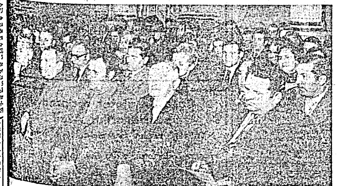
Aspect din timpul desfășurării lucrărilor plenarei Comitetului județean de partid.