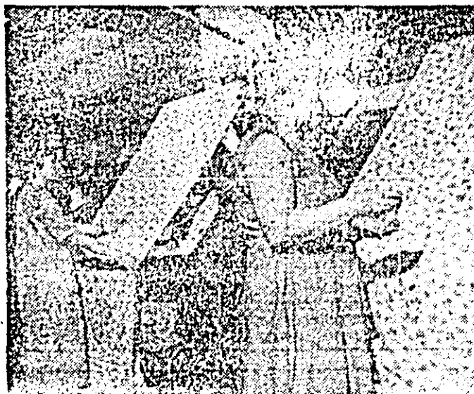
Aspect de muncă la rampa de control al calității din secția (Insa) a întreprinderii textile.

Înainte de termen și-a întotodată, că întregul spor de deplinit sarcinile ce-l reve-seama creșterii continue a neau pe șapte luni din acest an și colectivul întreprinderii forestiere de exploatare și transport. Adăugînd sporul de producție obținut pînă acum, împline cea de-a 45-a aniversare a revoluției de eliberare a țării de elibere socială și națională, anpe întreagă această perioadă de s-a obținut o producție marfă la 23 August cu succese deosebită în valoare în muncă, colectivul de 6,5 milioane lei. Acest spor de întreprinderii a luat măsuri ca pînă la această mîreață lum de produse fizice realizat prin sortarea și valorificarea superioară a masei lemnoase planificată pentru exploatare, prin semlindustrializarea ei în condiții de eficiență ridicată. Menționăm, 1939.