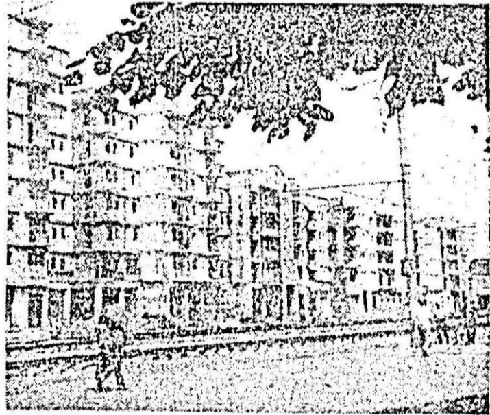
Din nolle realității arădene: În zona gării se construiesc alte și alte blocuri de locuințe.