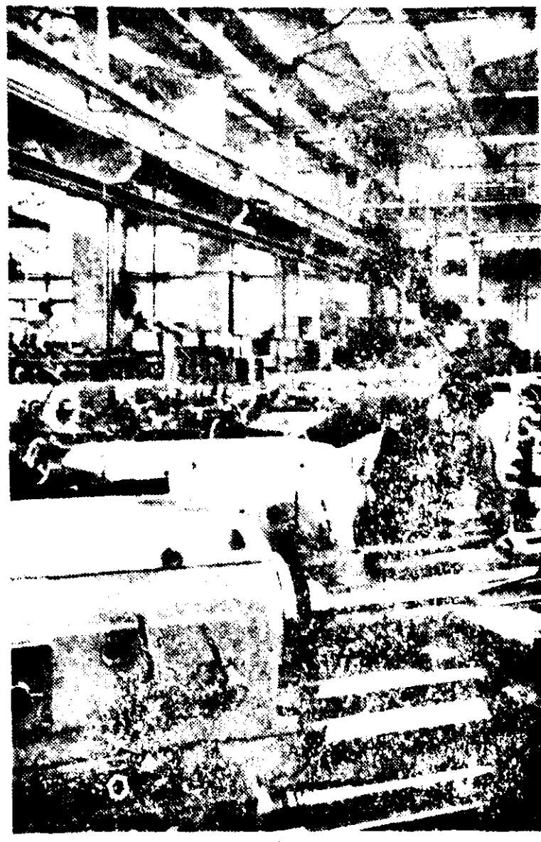
Aspect din secția montaj a Uzinei de strunguri.