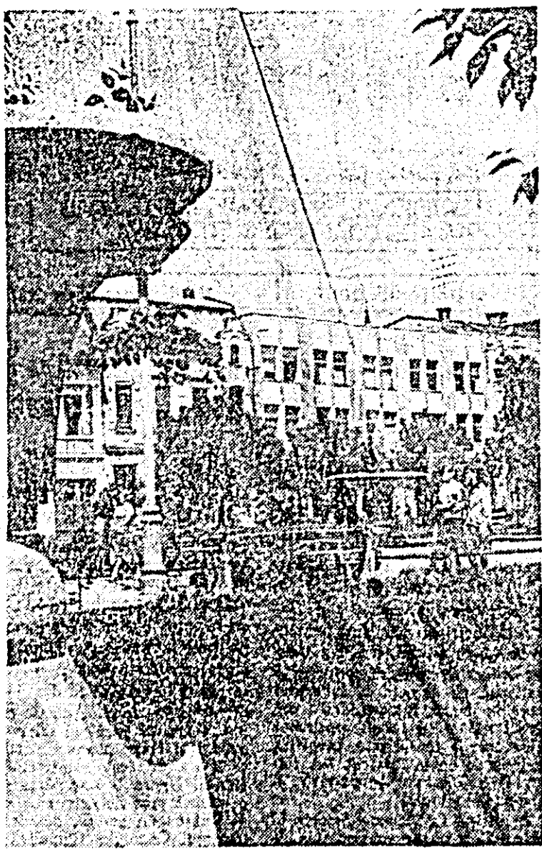
Imagini noi în centrul orașului Lugoj