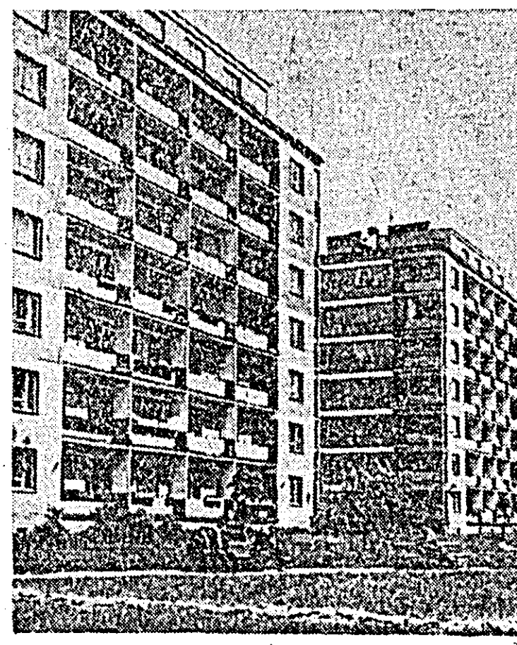
Un aspect din Varșovia de azi: cvartalul de blocuri tip din cartierul Wola.