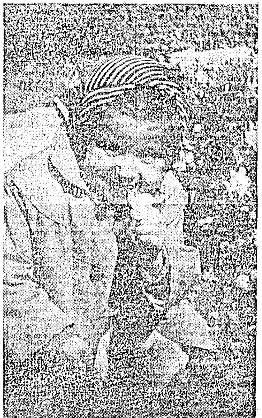
Și toamna sînt flori frumoase...