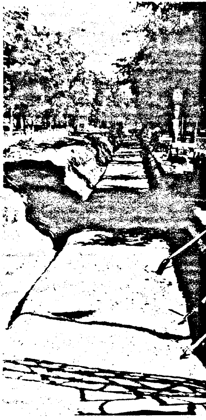
În așteptarea lucrătorilor...