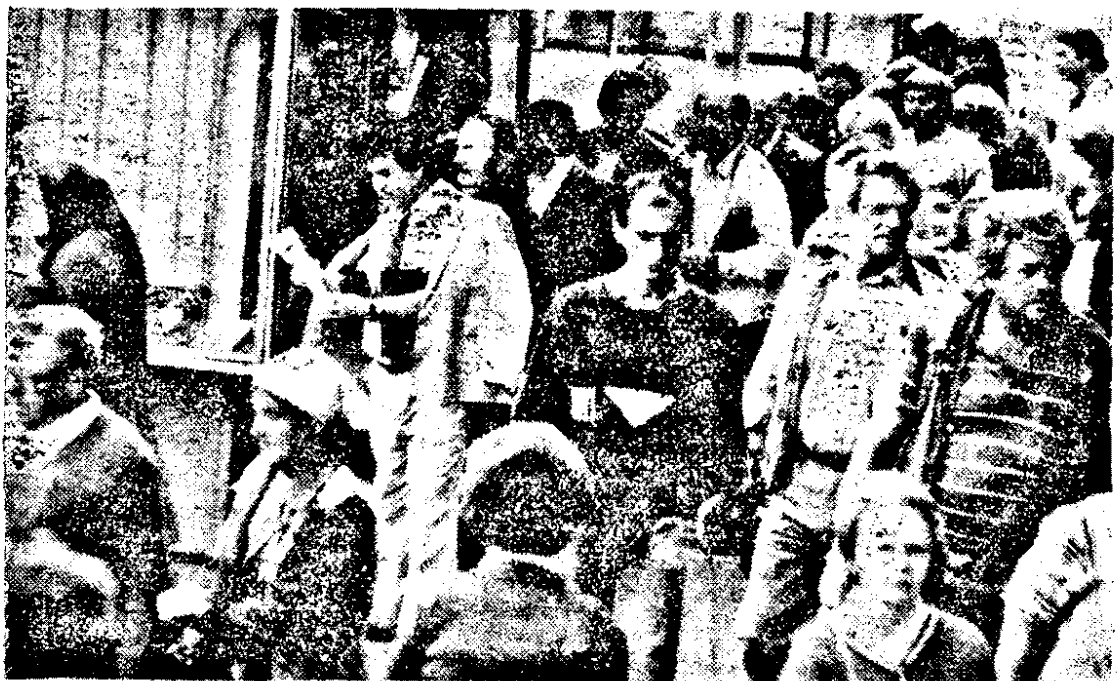
La ordinea zilei: evenimentele din URSS.