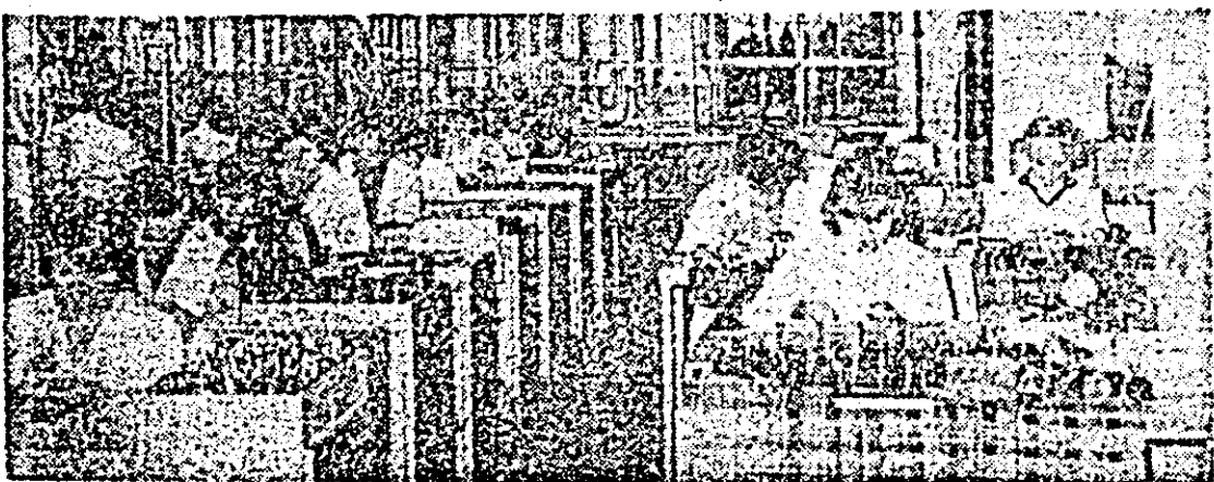
Aspect de muncă în atelierul montaj — Întreprinderea de orologerie industrială.