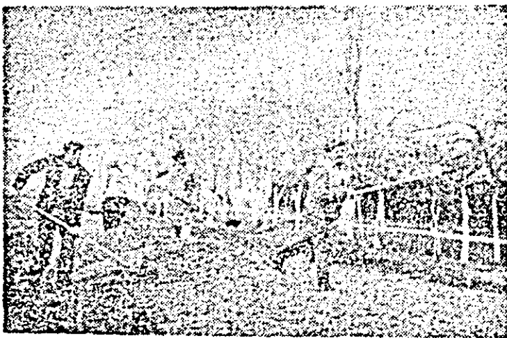
Mobilizați de consiliul popular, cetățenii Nădlacului participă în număr mare la întreținerea străzilor, la alte asemenea acțiuni.