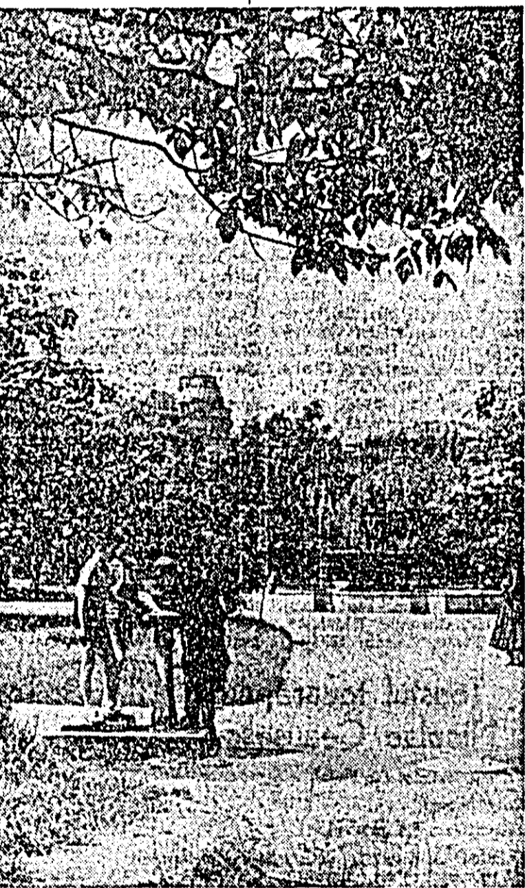
În parcul Vasile Roșii

La fabrica „Telcoul roșu” sînt în curs numeroase măsuri privind organizarea științifică a producției și a muncii. De mare eficiență este schimbarea timpului de deservire a utilajelor în secția Raschel. Printr-o mai bună amplasare, trei muncitori pot deservi acum patru mașini. Pe an eficiența acestei măsuri se ridică la 150.000 lei, prin creșterea productivității muncii.