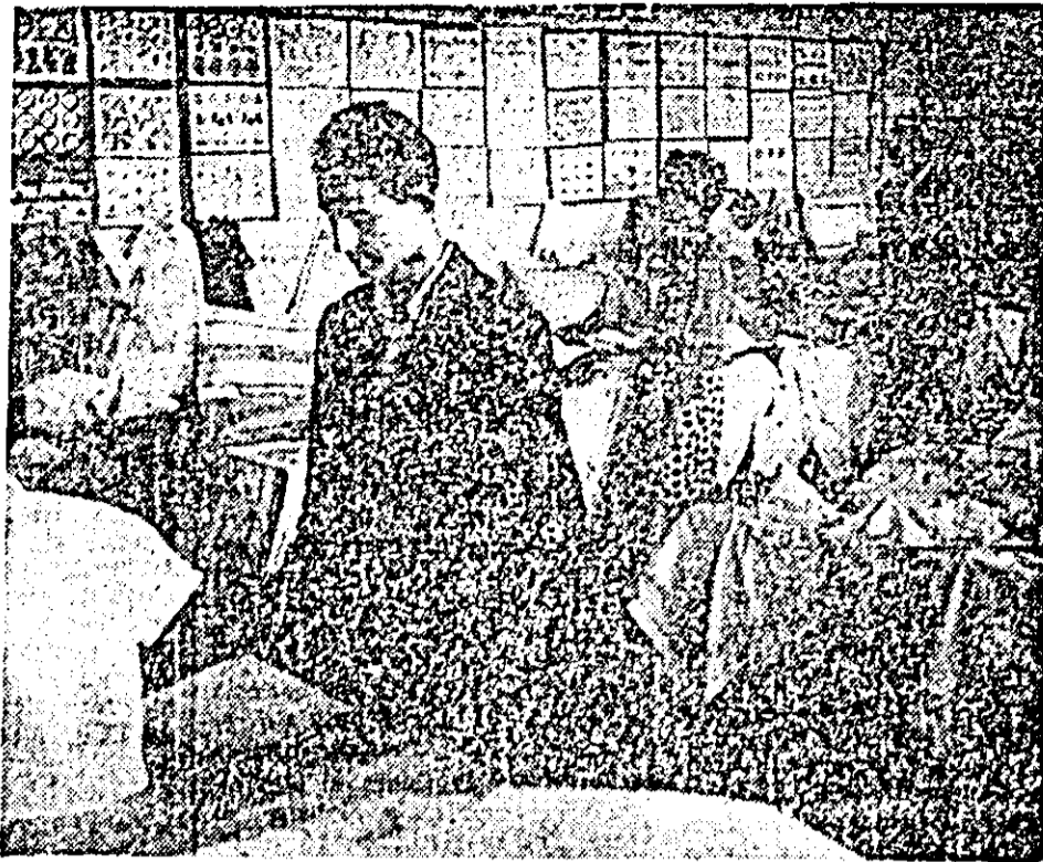
Aspect din expoziție

Primii care au pășit sim-bătă dimineața pragul sălii de clasă de la parterul Școlii generale nr. 19, unde cu prilejul încheierii anului școlar, s-a organizat expoziția cu lucruri de mână, au fost elevii claselor V—VIII. Fiecare a pășit cu emoție prin băncile acoperite cu exponate căuștindu-și numele sau lucrarea executată. Au fost adunate aici cîteva sute de piese: fețe de mese, de perini, șervețele, bluze, rochițe decorate cu frumoase căușturi