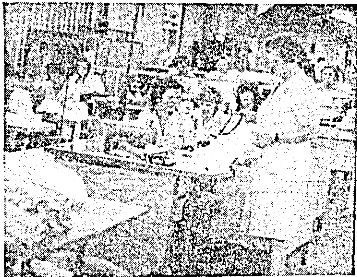
Aspect de muncă în atelierul Haisaj al întreprinderii „Tricolor roșu”.