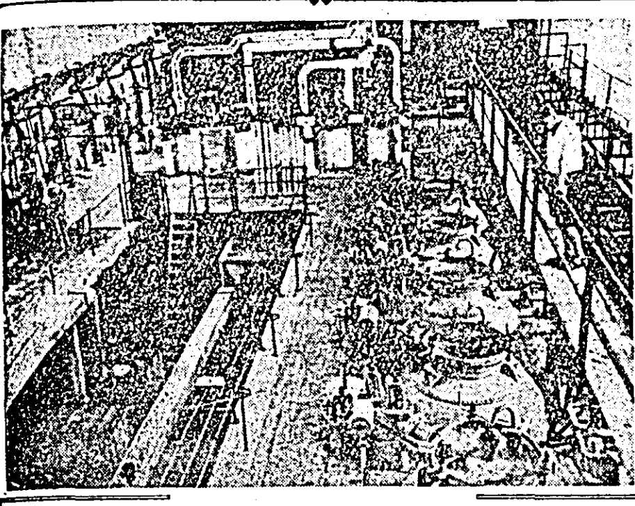
Fabrica de zahăr. De curând a început noua campanie de fabricație. În clișeu: un aspect din hala în care funcționează difuzoarele.