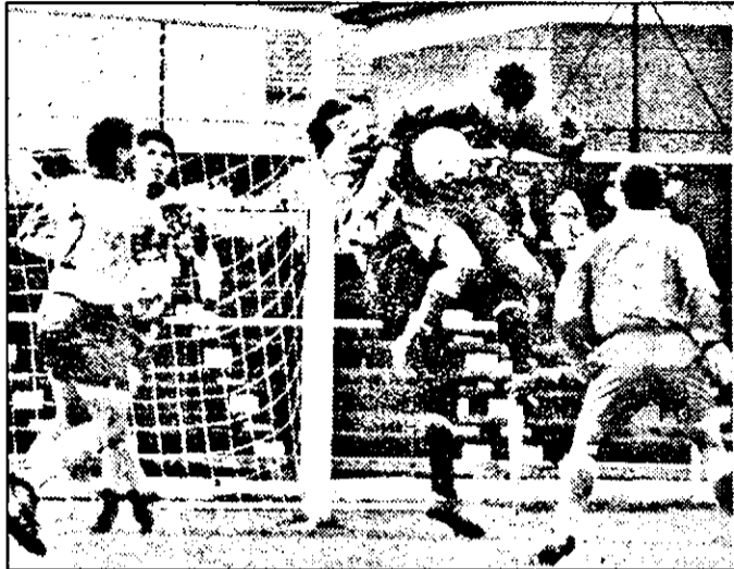
Ultima întâlnire dintre cele două echipe a avut loc în luna martie a acestui an, la Arad, când ambele formații au înscris câte un gol.