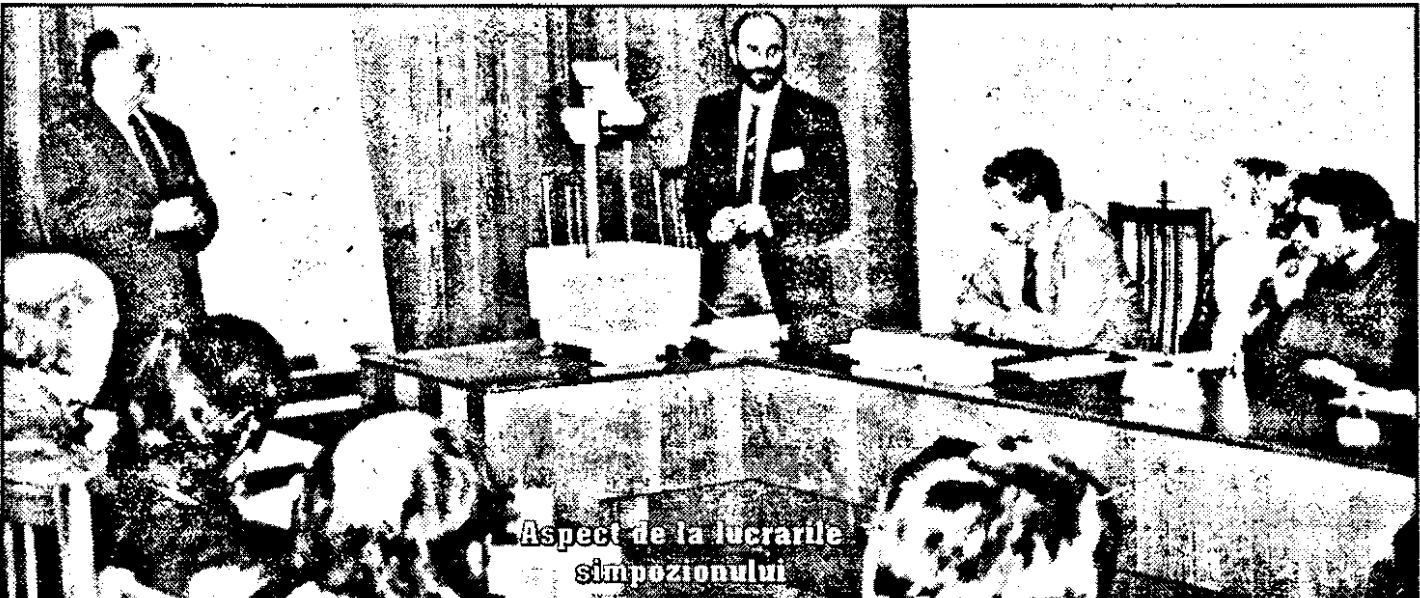
Aspect de la lucrările simpozionului

Întreprinderile Mici și Mijlocii, în economia românească