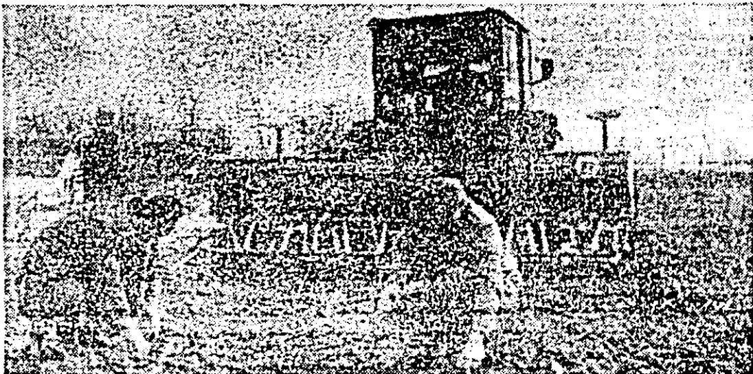
Cu răspundere, cu grijă deosebită pentru calitate, așa au debutat lucrările din campania de primăvară la C.A.P. Șilindia.