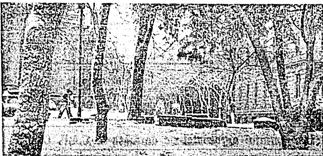
larnă, în noiembrie, la Arad.