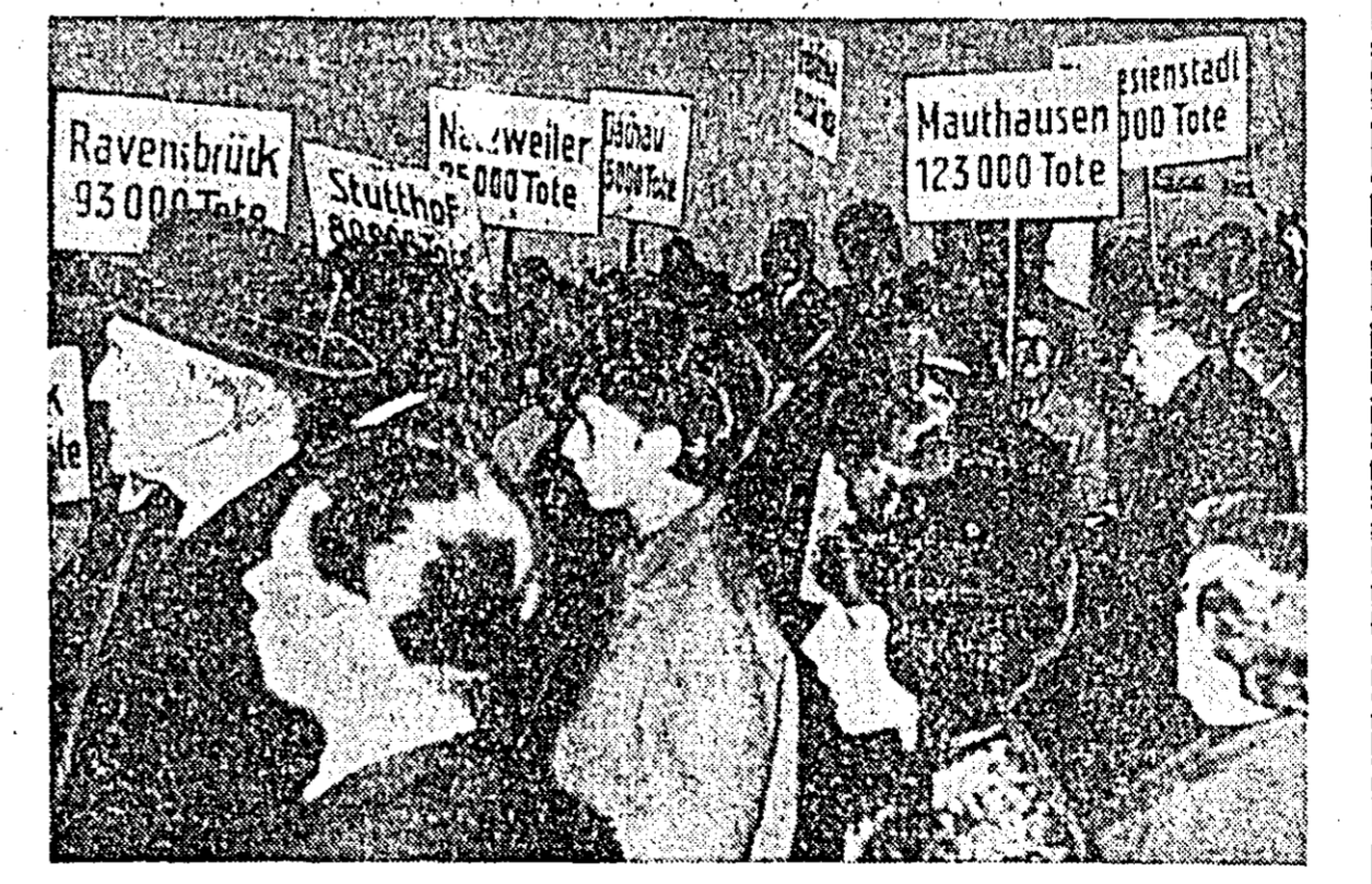
Peste 600 de cetățeni din Schleswig-Holstein (RFG) au protestat împotriva libertății nazistilor de a se înfrunți la conferințe. În cursul manifestației, au fost purtate pancarte pe care figura numele lagărelor de concentrare naziste și numărul victimelor.

MOSCOVA 15 (Agerpres). — Stația interplanetară „Venus-2”, lansată la 12 noiembrie în direcția Planetei Venus își continuă zborul. S-a stabilit pînă în prezent de șase ori legătura prin radio cu stația. De ne burdul stației au fost recepționate informații asupra funcționării sistemelor și aparatelor și au fost efectuate măsurători ale trajectoriei. Întregul aparat al stației funcționează normal. Legătura prin radio este bună, comenzile la bord se transmit cu precizie. La 15 noiembrie ora 18.00 (ora Moscovei), stația se afla la distanța de 1.149.000 km de Pămînt, deasupra punctului terestru cu coordonatele 15 grade 03 minute latitudine nordică și 21 grade 54 minute longitudine estică.