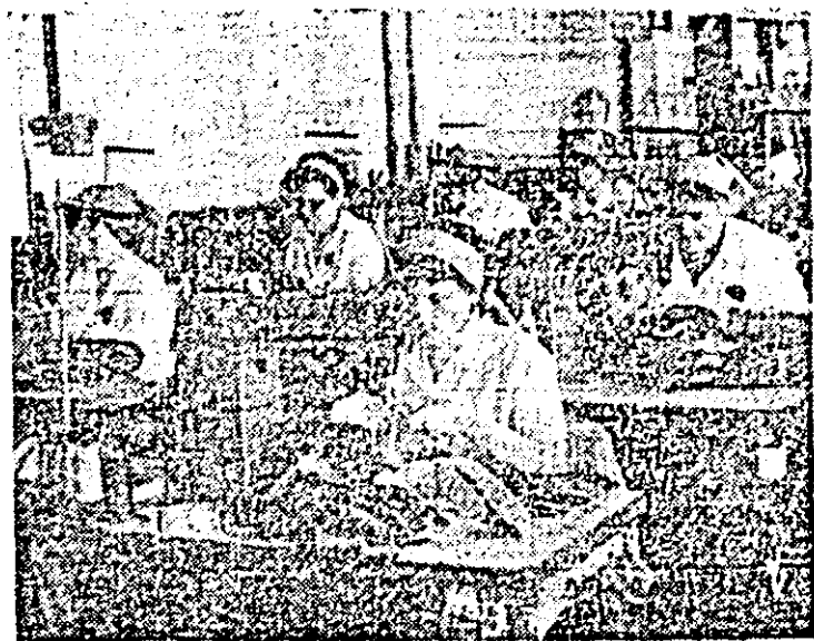
Aspect de muncă din atelierul cusut-pregătit al întreprinderii „Liberatea”.