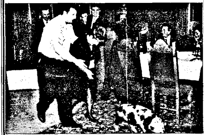
La „Tombola norocoșilor” s-au câștigat obiecte de folosință îndelungată, diferite cadouri și chiar un simpatic animaluț - desigur, aducător de noroc. Foto-text: AL. MARIANUȚ