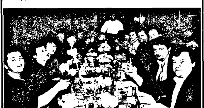
Sâmbătă, 16 ianuarie a. c., într-o atmosferă de bună cu speranțe de mai bine - personalul restaurantului cu familiile a sărbătorit Anul Nou.