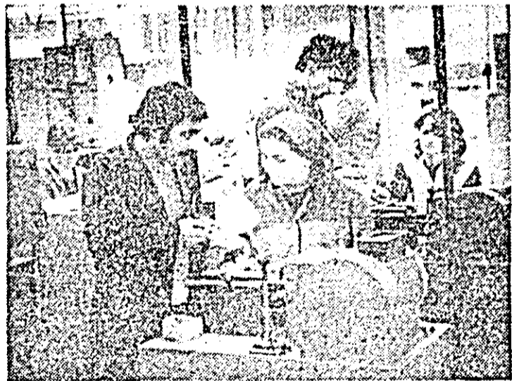
Aspect de muncă în atelierul freze al Întreprinderii de orologerie industrială Arad.