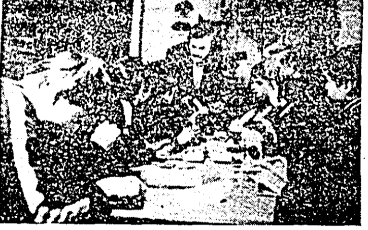
La Casa pionierilor și școlimilor patriei din Pecica, cercul de protecția mediului se bucură de o largă audiență. În imagine: pionierii execută lucrări practice de laborator.

I ntegrată etapei de masă la Festivalul național „Cîntarea României”, cea de a 22-a ediție a tradiționalei manifestări „Luna cărții la sate” a fost inaugurată duminică, 31 ianuarie a.c. în majoritatea localităților rurale de pe întreg cuprinsul județului nostru. Actuala ediție, ce se desfășoară în lumina indicațiilor privind activitatea politico-educativă date de tovarășul Nicolae Ceaușescu, în cuvîntarea rostită la Plenara comună a C.C. al P.C.R. și a Consiliului Suprem al Dezvoltării Economice și Sociale din 25-26 noiembrie 1981, omagiază, totodată, împlinirea a două decenii de la încheierea procesului de cooperativizare a agriculturii, avînd drept scop intensificarea activității de popularizare și difuzare a cărții în rândul tuturor categoriilor de oameni ai muncii din satele și comunele județului nostru. Subliniem, totodată, că locuitorii satelor noastre — țărani, muncitori și intelectuali — au beneficiat în a-