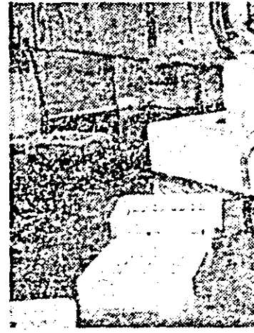
Aspect din subsolul blocului G din Piața Gării de nord. Deocîndată cărămizile încă sînt bloc de pod, dar dacă apa mai crește...

ricol de electrocutare (nu ne închipuim cum a putut fi ruptă că doar e din fier?); scări rupte; lămpile de pe coridoare pur și simplu smulse din lavaj; geamuri sparte; pînă și capacul de la terasă (acoperis) smuls de la locul lui, așa că blocul are „activitate centrală” și, cînd plouă, apă din belșug. În subsolul tehnic n-am