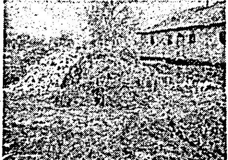
Aici e locul finului cumpărat, în nozoale?