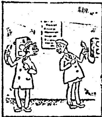
— Nici la dv. nu vine tonul? — Nici tonul, dar nici li...

Despre telefoanele publice defecte am mai scris. E adevărat că defectarea lor se datorază unor cetățeni certăți cu bunul simț, dar nici recuperarea defectiunilor nu se face operativ.