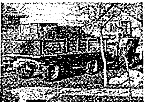
Tractoarele aleg să mergă prin comună ducînd o singură remorcă...