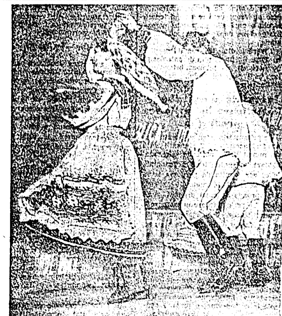
Formația de dansuri populare de la ICDA executînd un joc popular

În cursul acestei săptămîni, în fiecare zi la orele 6,15, posturile noastre de radio transmit pe programul I, următoarele emisiuni pentru ascultătorii de la sate. Luni: Carnot științific. — Folosirea izotopilor radioactivi în cultura plantelor și creșterea animalelor; Mari: Statul zootehnologic. — Ingrășirea și hrănirea oilor și mielilor în această perioadă; Miercuri: Vestii de la corespondenții voluntari; Joi: Vestii din satele patriei. De asemenea în fiecare duminică la orele 16,30, pe programul I, se transmite emisiunea „La șezătoare”, iar miercuri la orele 19,05, pe programul I, „Jurnalul satelor”.