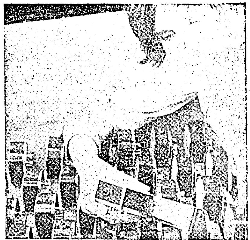
Control de calitate la un nou lot de ceasornice produse la I.I.S. „Victoria” Arad.