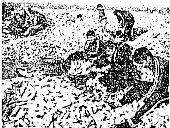
După ce combinele adună știuleții, mîndle harnice ale elevilor Liceului Industrial nr. 1 din Arad depănușează porumbul.